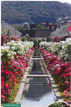
水路に沿って植栽されたバラが壮大な景観を作り出す「カスケードガーデン」や、この時期にしか出会えない「バラの回廊」など、立体的に植栽されたバラを堪能できるガーデン。